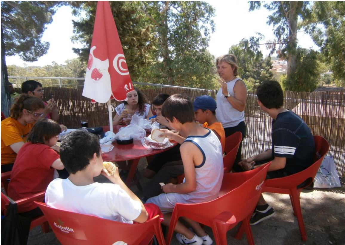
Terrassa – Bar que accedeix al pont per veure el pantà.

A la tornada, l'Escola Alba va voler parar al Pantà de Riudecanyes perquè els nens, nenes i professores poguessin dinar a la fresqueta.